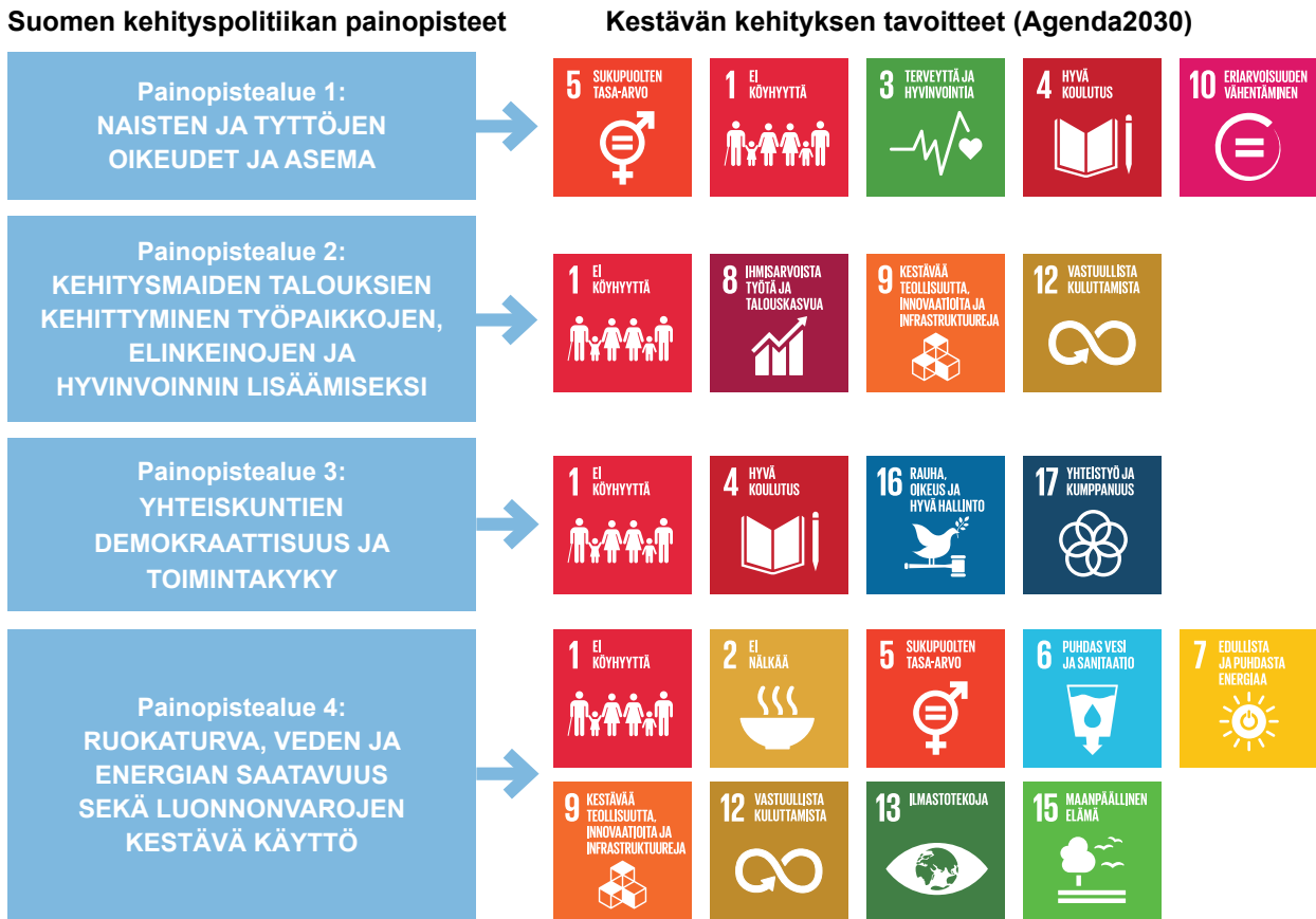
Kuvio 3. Suomen kehityspolitiikan painopisteet ja kestävän kehityksen tavoitteet 2016–2030.

Suomi oli ensimmäinen maa maailmassa, joka toteutti itsenäisen ja riippumattoman evaluoinnin Agenda2030:n kansallisesta toteutuksesta. Ensimmäisen Agenda2030:n arvioinnin, ”Kehittävä arviointi Suomen kestävän kehityksen politiikasta ja muutospoluista” (POLKU2030 -hanke), suunnittelu aloitettiin keväällä 2018 valtioneuvoston kanslian johdolla ja itse arviointi toteutettiin aikavälillä elokuu 2018–helmikuu 2019. Arviointi toteutettiin kehittävänä arviointina, jonka olennainen piirre on osallistavuus: arvioinnissa tarjottiin kestävän kehityksen politiikan keskeisille toimijoille ja sidosryhmille laajasti osallistumismahdollisuuksia useiden työpajojen ja haastatteluiden muodossa. Kehitysevaluoinnin yksikkö oli asiantuntijaroolissa arvioinnin ohjausryhmässä, johon oli kutsuttu keskeisiä toimijoita eri hallinnon aloilta. Yksikön asiantuntijuutta hyödynnettiin arvioinnin lähtökohtien, asetelman ja metodologian muodostamisessa sekä tulosten raportoinnissa.